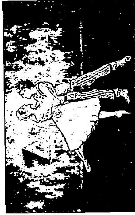
Постановка балета «Шурале» в Татарском государственном академическом театре оперы и балета им. М. Джалиля. Сююмбике и Былтыр (2-е действие)