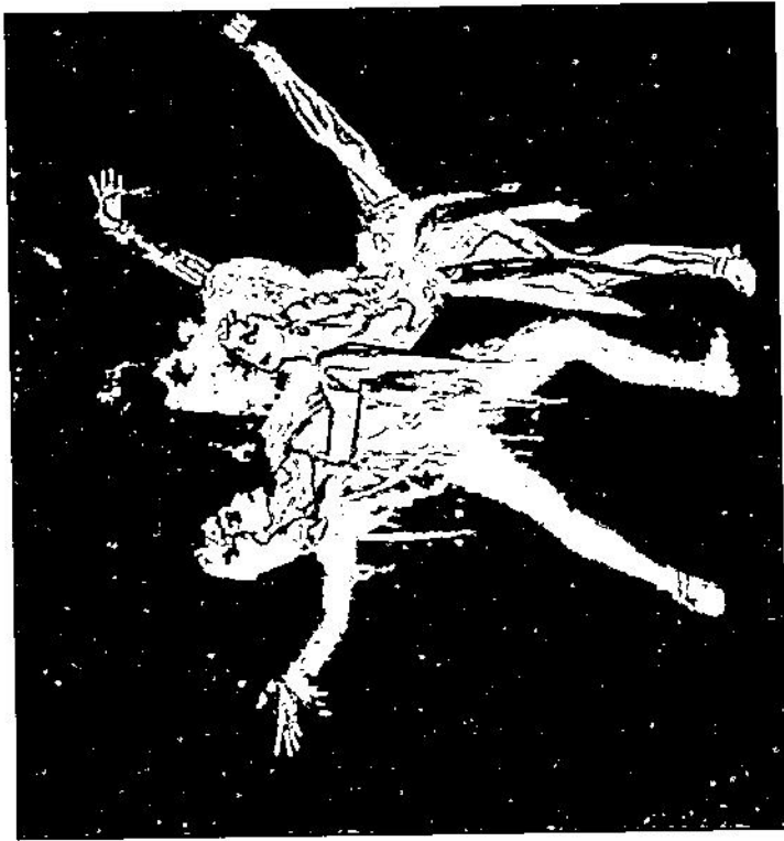
Постановка балета «Шурале» в Татарском государственном академическом театре оперы и балета им. М. Джалиля.